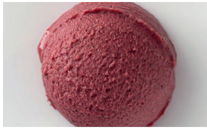
606146 Sorbetto Mirtillo Blaubeersorbet