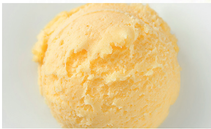
606788 Sorbetto Mandarino Mandarinensorbet