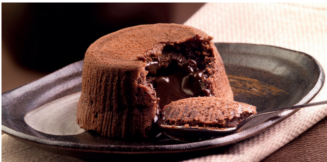
492466 Soufflé al Cioccolato Dunkles Schokoladensoufflé