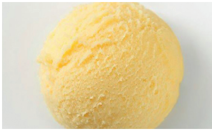
606160 Sorbetto Mango Mangosorbet