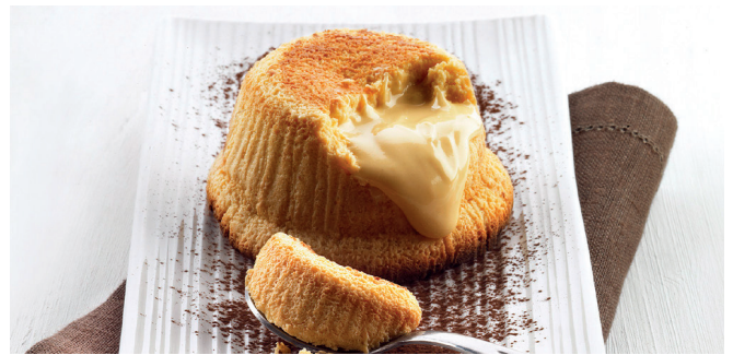
491896 Soufflé al Cioccolato Bianco Weißes Schokoladensoufflé

🥄 100 g/ Stk. 📦 12 Stk./ Krt. ⌚ 4-10 Min. 🌡️ 180 °C