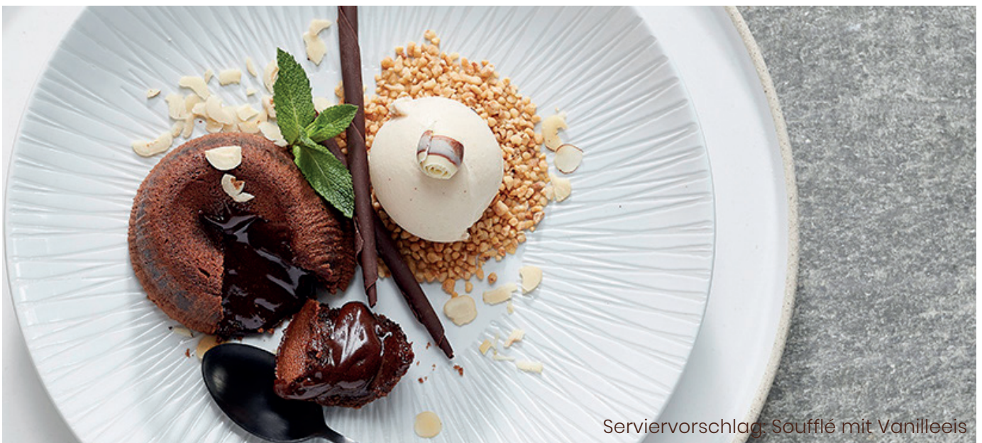
Serviervorschlag: Soufflé mit Vanilleeis

🥄 100 g/ Stk. 📦 12 Stk./ Krt. ⌚ 4-10 Min. 🌡️ 180 °C