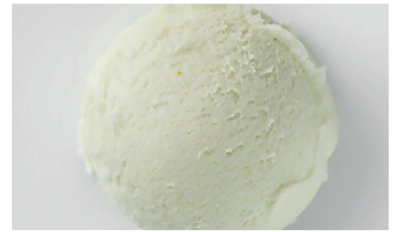
603152 Sorbetto Mela Verde Grünes Apfelsorbet