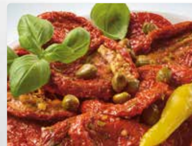
Getrocknete Tomaten mit Kapern und Kräutern.

Artikel: ..... Art.-Nr.: Bowl, 500 g ..... 130 065