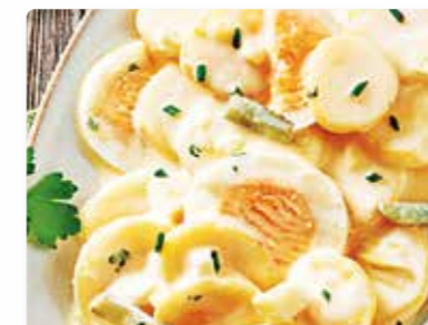
Pellkartoffelsalat mit Ei Der Klassiker mit gekochten Eiern und Gurken in Salat-Mayonnaise