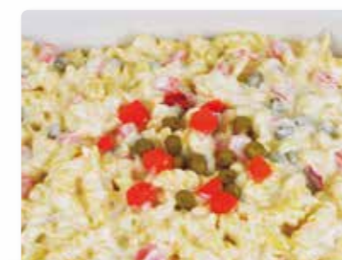
Nudelsalat „Norddeutsche Art“ Norddeutscher Klassiker mit Karotten, Erbsen und Paprika in Mayonnaise-Sauce.