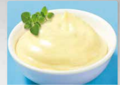
Salat-Mayonnaise mit 50 % Pflanzenöl