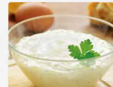
Delikatess-Remoulade mit 80 % Pflanzenöl