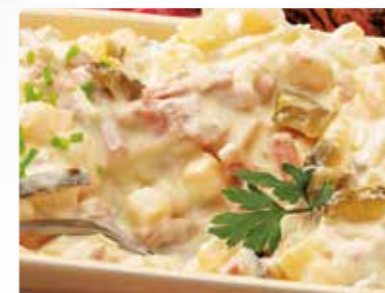
Sächsischer Kartoffelsalat Sächsische Art mit Fleischbrät, Gurken, Zwiebeln, Eiern und Schnittlauch in Salat-Mayonnaise.