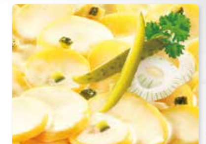
Pellkartoffelsalat Mit Gurken und Zwiebeln in Salat-Mayonnaise.