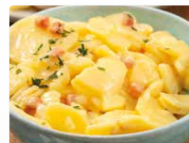
Speck-Kartoffelsalat Mit geräuchertem Schinken und Zwiebeln in einem würzigen Dressing auf Essig-Öl-Basis.