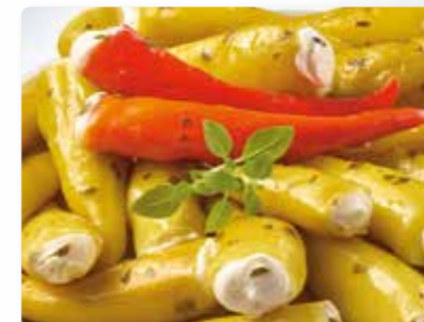
Peperoni grün gefüllt mit Frischkäse.

Artikel: ..... Art.-Nr.: Bowl, 500 g ..... 130 782