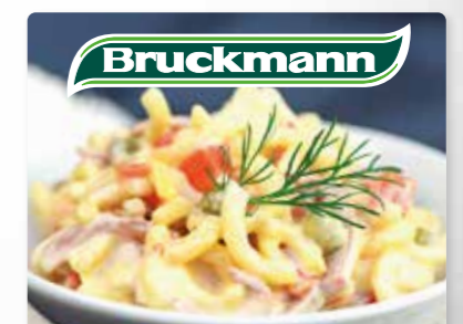
Bruckmann Nudelsalat Nudeln mit Fleischbrät, Erbsen, Paprika und Zwiebeln.