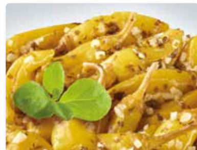
Peperoni mit Stil und Kopf.

Artikel: ..... Art.-Nr.: Bowl, 900 g ..... 130 386