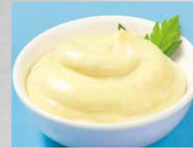
Delikatess-Mayonnaise mit 80 % Pflanzenöl