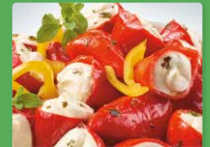
Sweet Chili Peppers

Artikel: ..... Art.-Nr.: Bowl, 900 g ..... 130 300