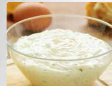
Remoulade nach Hausfrauenart Mit 43 % Rapsöl. Mit Gurken und Zwiebeln.