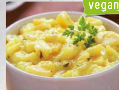
Kartoffelsalat Mit Essig und Öl.