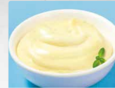
Salat-Mayonnaise mit 60 % Rapsöl „Unsere Beste“