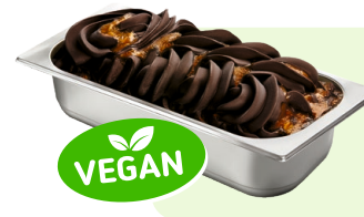
SCHOKO-CHILI-ORANGE (VEGAN) Schokoladenspeiseeis mit Chili und Orangensauce 4,6l Artikel-Nr. 00445