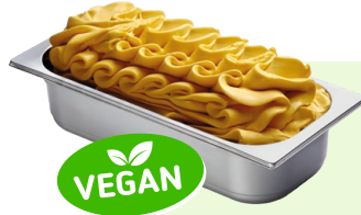
MANGO (VEGAN) Mangospeiseeis 4,6l Artikel-Nr. 00401