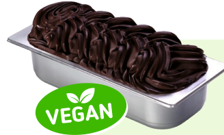
SCHWARZE SCHOKOLADE (VEGAN) Schokoladenspeiseeis 4,6l Artikel-Nr. 00405