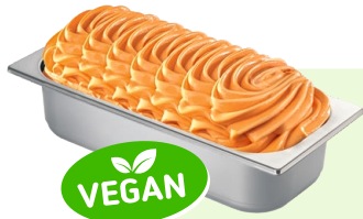
ACE (VEGAN) Speiseeis mit Mehrfrucht- und Karottengeschmack 4,6l Artikel-Nr. 605520