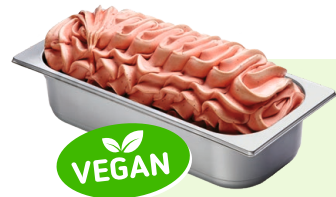
ERDBEERE (VEGAN) Erdbeerspeiseeis 4,6l Artikel-Nr. 00402