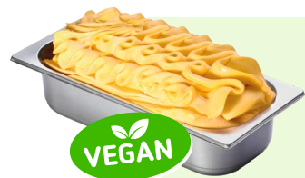
EXOTIC-PASSION FRUIT (VEGAN) Speiseeis mit Mehrfrucht (Mango, Pfirsich- konzentrat, Passionsfruchtkonzentrat, Ananassaftkonzentrat) 4,6l Artikel-Nr. 00418