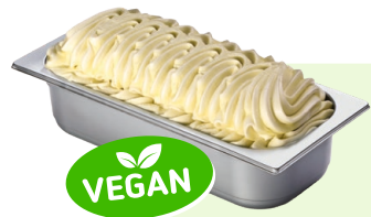
GRÜNER APFEL (VEGAN) Apfelspeiseeis 4,6l Artikel-Nr. 02240