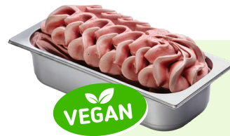
HIMBEERE (VEGAN) Himbeerspeiseeis 4,6l Artikel-Nr. 00433