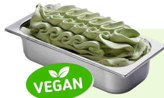
KIWI (VEGAN) Kiwispeiseeis 4,6l Artikel-Nr. 00441