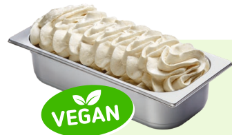
ANANAS (VEGAN) Ananasspeiseeis 4,6l Artikel-Nr. 00431