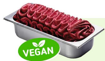
HEIDELBEERE (VEGAN) Heidelbeerspeiseeis 4,6l Artikel-Nr. 00427