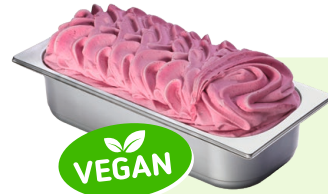
KIRSCH (VEGAN) Kirschspeiseeis 4,6l Artikel-Nr. 02303