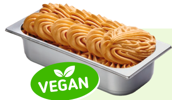
APRIKOSE (VEGAN) Aprikosenspeiseeis 4,6l Artikel-Nr. 00434