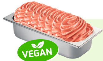
ERDBEER SORBET (VEGAN) Erdbeer Sorbet 4,6l Artikel-Nr. 605518