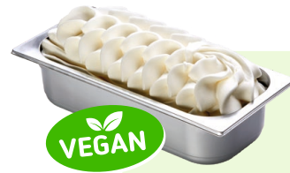
ZITRONE (VEGAN) Zitronenspeiseeis 4,6l Artikel-Nr. 00412