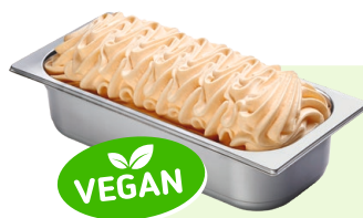
MELONE (VEGAN) Melonenspeiseeis 4,6l Artikel-Nr. 00435