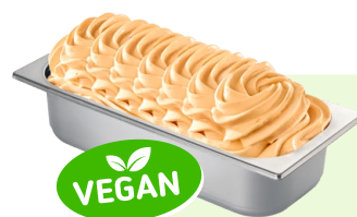
PFIRSICH (VEGAN) Pfirsichspeiseeis 4,6l Artikel-Nr. 605519