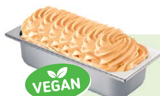
PFIRSICH (VEGAN) Pfirsichspeiseeis 4,6l Artikel-Nr. 605519