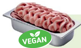
HIMBEERE (VEGAN) Himbeerspeiseeis 4,6l Artikel-Nr. 00433