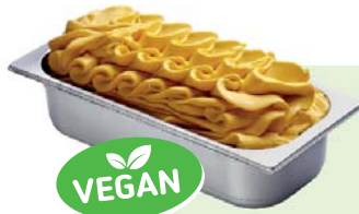
MANGO (VEGAN) Mangospeiseeis 4,6l Artikel-Nr. 00401