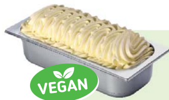
GRÜNER APFEL (VEGAN) Apfelspeiseeis 4,6l Artikel-Nr. 02240