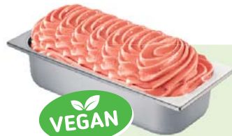
ERDBEER SORBET (VEGAN) Erdbeer Sorbet 4,6l Artikel-Nr. 605518