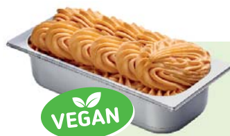
APRIKOSE (VEGAN) Aprikosenspeiseeis 4,6l Artikel-Nr. 00434