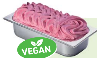
KIRSCH (VEGAN) Kirschspeiseeis 4,6l Artikel-Nr. 02303