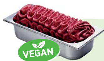
HEIDELBEERE (VEGAN) Heidelbeerspeiseeis 4,6l Artikel-Nr. 00427