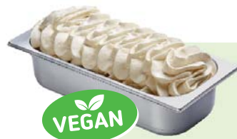
ANANAS (VEGAN) Ananasspeiseeis 4,6l Artikel-Nr. 00431