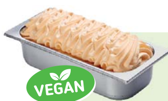
MELONE (VEGAN) Melonenspeiseeis 4,6l Artikel-Nr. 00435