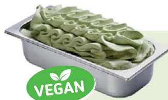
KIWI (VEGAN) Kiwispeiseeis 4,6l Artikel-Nr. 00441