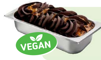
SCHOKO-CHILI-ORANGE (VEGAN) Schokoladenspeiseeis mit Chili und Orangensauce 4,6l Artikel-Nr. 00445