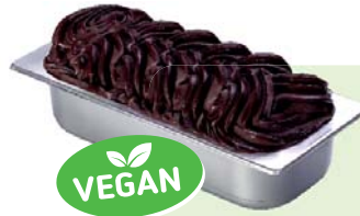
SCHWARZE SCHOKOLADE (VEGAN) Schokoladenspeiseeis 4,6l Artikel-Nr. 00405