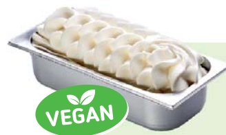
ZITRONE (VEGAN) Zitronenspeiseeis 4,6l Artikel-Nr. 00412