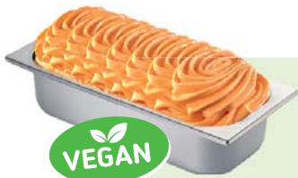
ACE (VEGAN) Speiseeis mit Mehrfrucht- und Karottengeschmack 4,6l Artikel-Nr. 605520