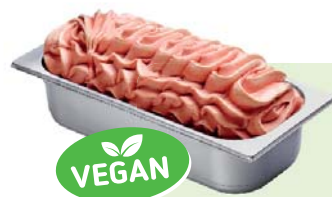
ERDBEERE (VEGAN) Erdbeerspeiseeis 4,6l Artikel-Nr. 00402