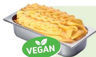
EXOTIC-PASSION FRUIT (VEGAN) Speiseeis mit Mehrfrucht (Mango, Pfirsich- konzentrat, Passionsfruchtkonzentrat, Ananassaftkonzentrat) 4,6l Artikel-Nr. 00418